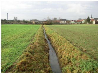
Gewässer ohne Gewässerrandstreifen