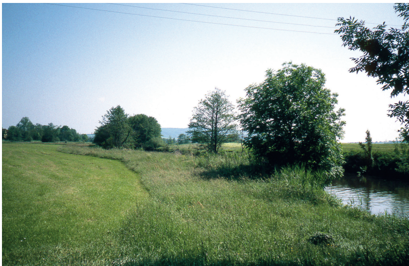
Gewässerrandstreifen mit Beschattung für das Gewässer

Für die einhergehenden Einschränkungen bisher zulässiger und tatsächlich ausgeübter Nutzungen aufgrund der gesetzlichen Vorgaben zum 5 Meter-Gewässerrandstreifen soll nach Maßgabe der verfügbaren Haushaltsmittel ein angemessener Geldausgleich gewährt werden. Die Grundlage für die Ausgleichszahlungen wurde bis Ende 2019 gemeinsam durch die Bayerischen Staatsministerien für Ernährung, Landwirtschaft und Forsten sowie Umwelt und Verbraucherschutz geschaffen. Die geplanten Ausgleichszahlungen sind beihilferelevant, weshalb ein EU-Notifizierungsverfahren erforderlich ist. Die Vorlage der Unterlagen bei der EU-Kommission erfolgte über das Bundesministerium für Ernährung und Landwirtschaft im Januar 2020. Erfahrungsgemäß ist für das Notifizierungsverfahren von Seiten der EU mindestens ein Jahr anzusetzen.