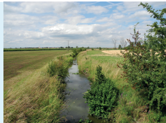
Gewässer mit Gewässerrandstreifen